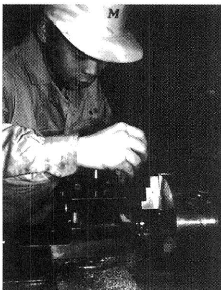
竹ブラシで芯だし

旋盤工の道具のひとつに竹ブラシがある。人間が使 う歯ブラシと形も大きさも似ている道具で、消耗品で あるのでバイトや測定器のように大切に取扱い扱うとい うような道具ではないが、旋盤加工にはなくてはなら ない重宝な道具である。この竹ブラシは切削加工して いる時に切削油を切削部に与えたり、品物に付着して いる削り屑などを取り払う作業に使うのが普通の使い 方である。私は、竹ブラシの柄の部分を利用して品物 の芯だしに使っている。例えば円板状の厚みが3〜1 0ミリメートルのような部品をチャックにつかませる と当然ながらいくら傾いてしまう。この時、つかみ