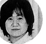
ふきの先生 ( )