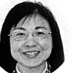
しずか先生 ( )