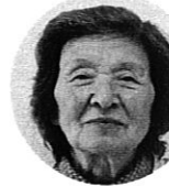
まきの先生 ( )