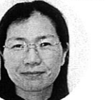
まさの先生 ( ) 看護