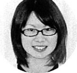
こまつ先生 ( )