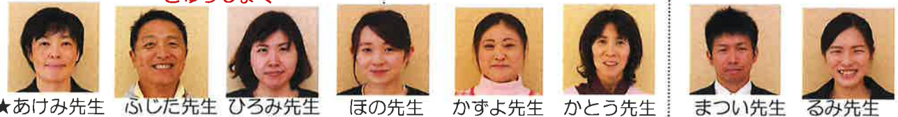
★あけみ先生 ふうじた先生 ひろみ先生 ほの先生 かずよ先生 かとう先生 まついい先生 るみ先生