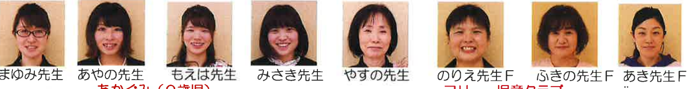
まゆみ先生 あやの先生 もえは先生 みさき先生 やすの先生 のりえ先生F ふうきの先生F あき先生F