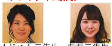
★じゅんこ先生 ももこ先生