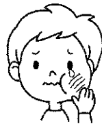
生えてくる永久歯もむし歯になりやすい