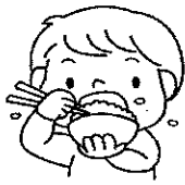
噛みにくいため食事がおいしくない

乳歯は、むし歯になってもそのうち永久歯に生えかわるから...とそのままだしておかれることがよくあるようです。たった1本のむし歯でも、からだに様々な悪い影響を与えます。定期的に歯科健診を受けたり、早めに治療することが大切です。