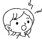
発音がうまくできない