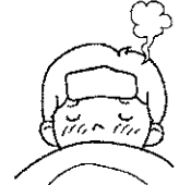
口の中に菌がいるため病気にかかりやすい