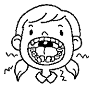
永久歯の形や歯並びが悪くなる