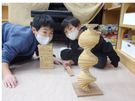
思い思いに過ごしています。

すごく寒い日があったり、春のような暖かい日もあったりしていますが、子どもたちは元気いっぱい外でよく遊んでいます。半袖・半ズボンで過ごす子もいて、子どもたちの元気に驚かされます。室内ではマスクをして、密になりすぎないように自分たちで気を付けながらも楽しく遊んでいますよ！