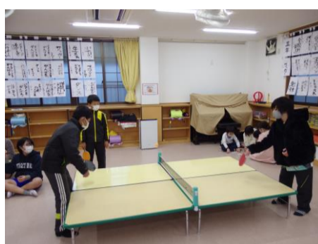
卓球は学年・性別問わず人気です。