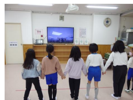
遊戯会の練習が始まりました。