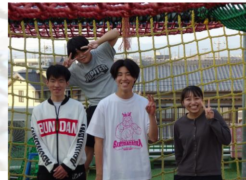
補助支援員の皆さん