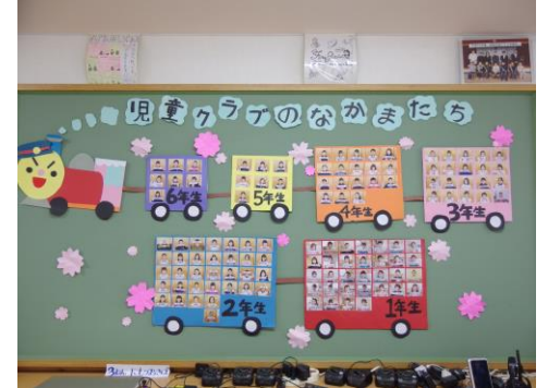
新年度の準備も出来ました。