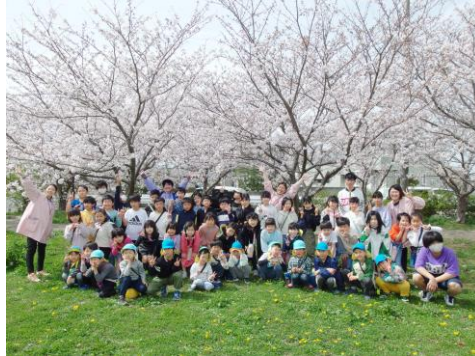
園児たちとお花見に行きました！