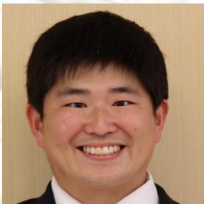
しょうご せんせい