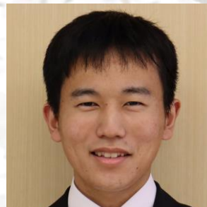
しょうた せんせい