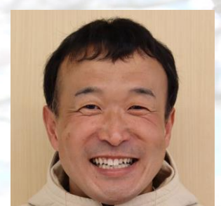
いしかわ せんせい