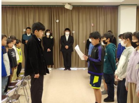
今年も涙の卒業式となりました。

新年度最初は希望保育期間中ということもあり出席している子は少なかったですが、小学校入学前の新1年生も連れて、お花見や公園に遊びに行ってきました。今年度は今まで出来なかった分、積極的にお出かけやイベントに参加していききたいと思います。ぜひ、クラブでの様子をおうちで聞いてみてくださいね！！