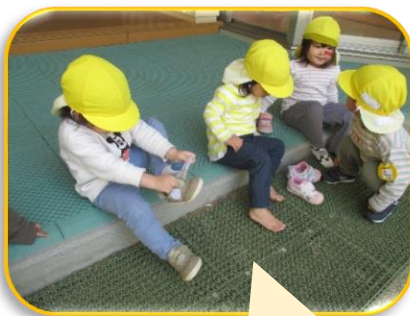
ひとりではけるよ

と感じてしまうこともありますが、温かく見守っていきたいですね。写真と共に毎日頑張っている姿を紹介します。