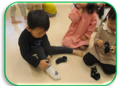
バランスを上手にとりながら履いています。

このように毎日頑張っていますよ。子ども達の「できた！」につながるように、着脱しやすい衣服を着てきてくださいね。また衣服（靴下や朝履いてくるオムツなど）の記名の確認をお願いします。