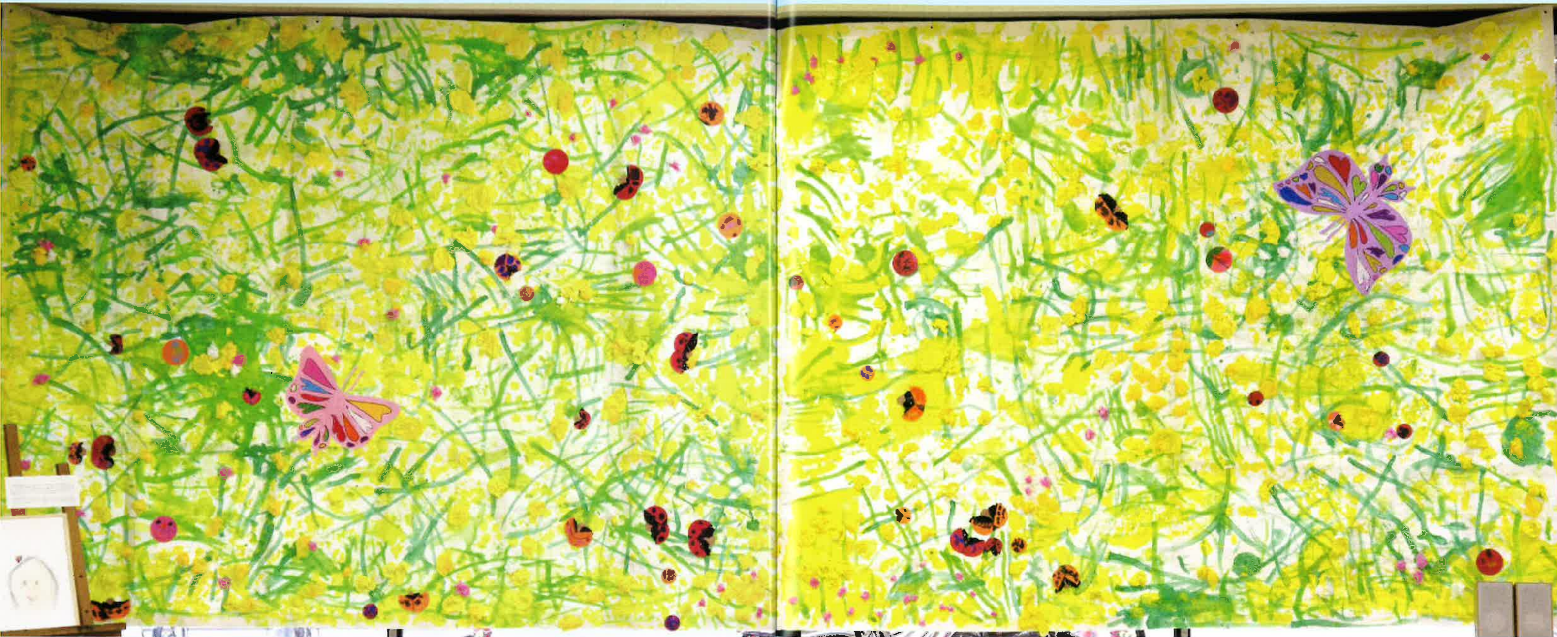
【3歳児による協同制作】 【Робота трирічних дітей】