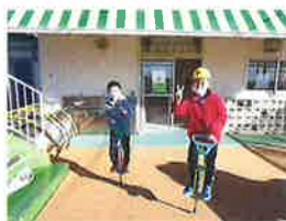
ホッピングは運動量が多く、寒い日には最適です。