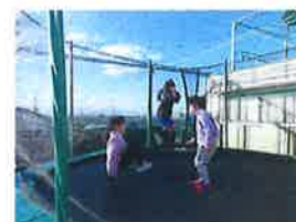
トランポリンも新しくなりました！