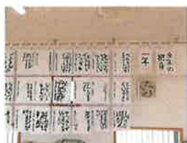
今年の抱負を筆で書きました。

すごく寒い日があり、春のような暖かい日もあったりしていますが、子どもたちは元気いっぱい外でよく遊んでいます。半袖・半ズボンで過ごす子もいて、子どもたちの元気に驚かされます。新しいボールやホッピング、フリスビー、漫画なども増え、クラブでの生活は充実した毎日となっていますよ！