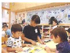
お手伝いは積極的にしてくれました。

夏休み中、児童クラブで朝から過ごす子どもたち。暑さに負けず、毎日元気に過ごしていました。時間がたくさんあるので、将棋や卓球の試合をしたり、保育園の小さい子どもたちのクラスにお手伝いに行ったりするなど、普段ではなかなか出来ない活動もしていました。また、園児の誕生会にも参加し、お楽しみに出演する子どももいますよ～。