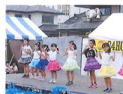
ダンスとトーチの演技を発表しました。