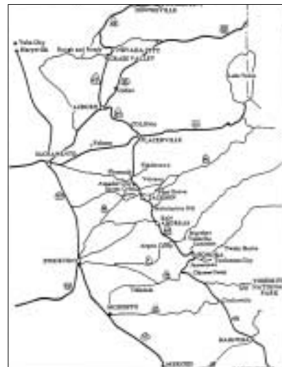
サクラメント近郊地図