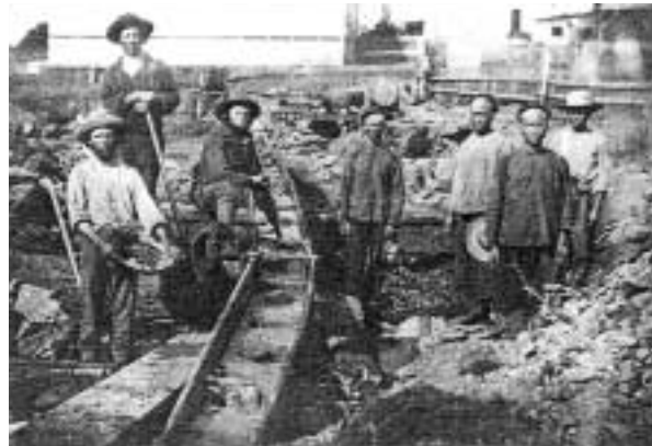
中国系移民を使った金発掘現場

(『America in the Time of Lewis and Clark』 P38 より)