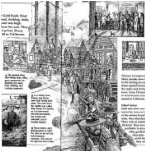
当時の町（ニュータウン）の様子

(『America in the Time of Lewis and Clark』 P38 より)