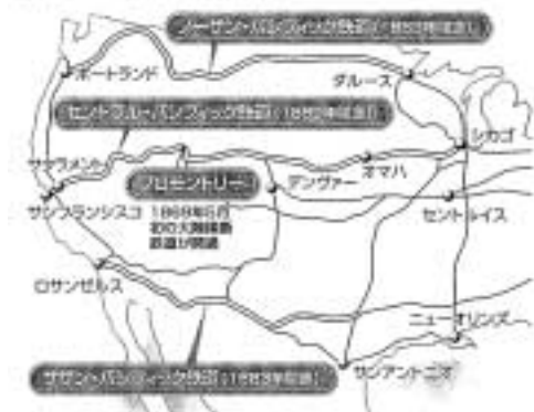
大陸横断鉄道絵図