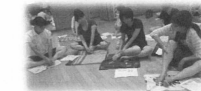
2018年度 ジョイフルタイム