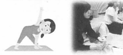
2019年度 ジョイフルタイム

女性教員のふれ合いと親睦を深めるため、エクササイズ講座を企画していた。今年は新型コロナウイルスの影響により、あまり外出できず、運動不足が問題となっていたので、屋内で気軽にできるエクササイズを体験したいと考えていた。しかし、夏までに新型コロナウイルス感染症が収束にいたらなかったため、今年度のジョイフルタイムは中止となった。