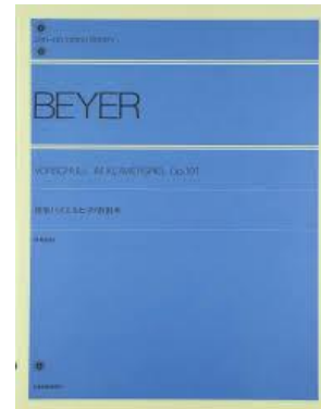
「標準バイエルピアノ教則本」 (全音楽譜出版社)