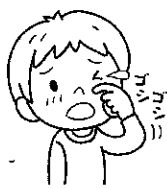
眼のかゆみと充血