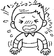
突然連続するくしゃみ

症状は、くしゃみや鼻水、鼻づまりです。花粉症では、皮膚の発赤やかゆみ、目の周囲の腫れがみられることがあります。