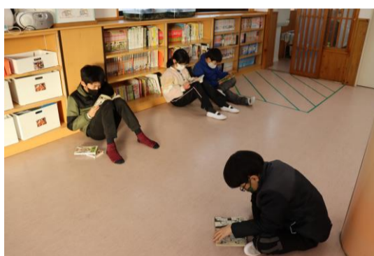
室内では読書をしたりしています。