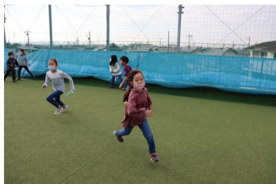
寒い日でも屋上で元気に遊んでいます。

すごく寒い日があったり、春のような暖かい日もあったりしていますが、子どもたちは元気いっぱい外でよく遊んでいます。半袖・半ズボンで過ごす子もいて、子どもたちの元気に驚かされます。室内ではしっかりとマスクをして、密になりすぎないように自分たちで気を付けながらも楽しく遊んでいますよ！