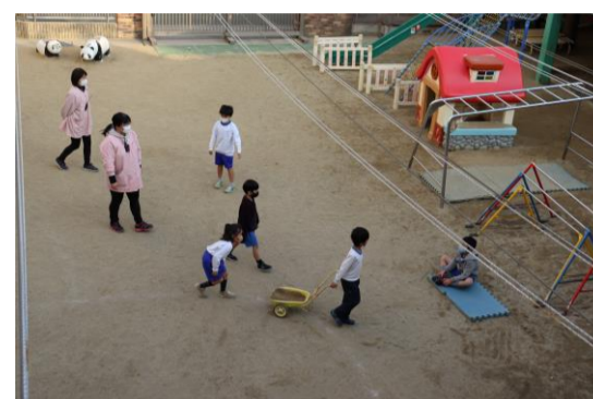
園庭も使い、広い場所で遊んでいるよ☆