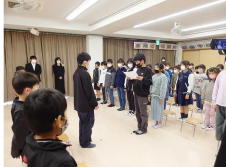
今年も涙の卒業式となりました。

新年度最初は希望保育期間中ということもあり、出席している子は少なかったですが、小学校入学前の新1年生も連れて、お花見や公園に遊びに行ってきました。今年度はリレーマラソンなどのイベントも開催される様なので、積極的に参加していきたいと思います。