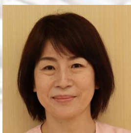
ないとう せんせい