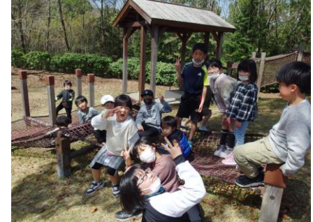
バスに乗ってふるさと公園にも行きました。