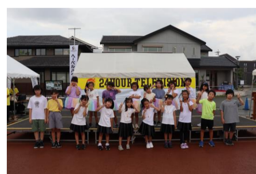
ハウジングセンターで発表をしました。