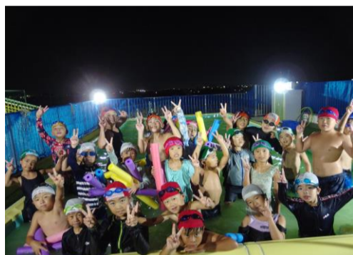
夜の集いを楽しみました。