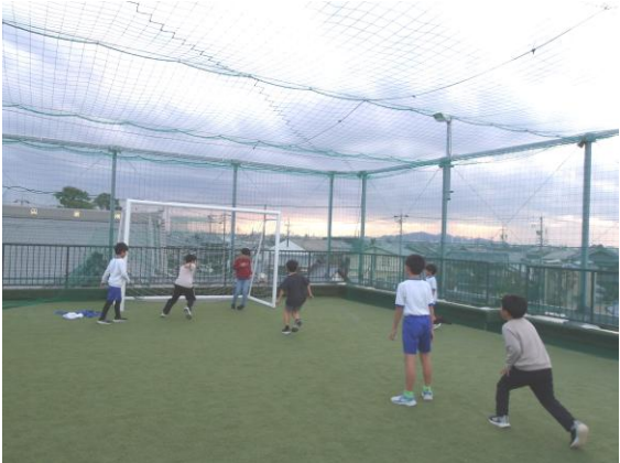
寒くても元気に遊びます！！