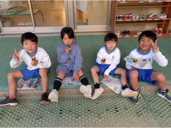
みんなで焼き芋を食べました