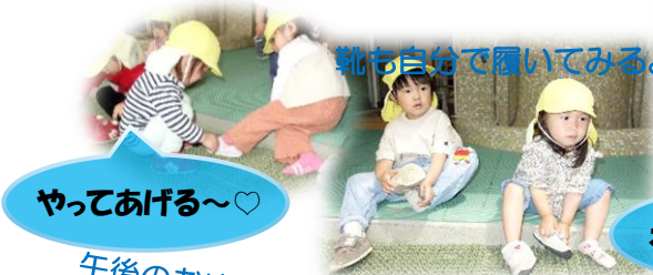
靴も自分で履いてみるよ☆

ゆきぐみでの生活にも慣れてきて、身の周りのことも少しずつできるが増えてきました! 体操ものびのび楽しんでます★ みんなでいろいろなことを やってみよう!