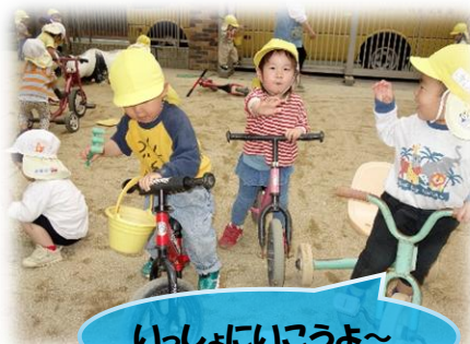
いっしょにいこうよ～

楽しいこと、みつけた! 新しいお友だちや先生と、好きなあそびを みつけた! たくさん体を動かしたり、見立てあそびをしたり、絵の具を使った製作を試してみたり…♡あそびの中でいろいろな わくわく に出会っています♪