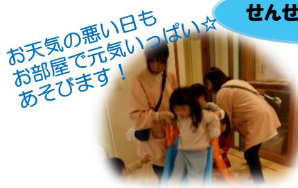
お天気の悪い日もお部屋で元気いっぱい☆あそびます!