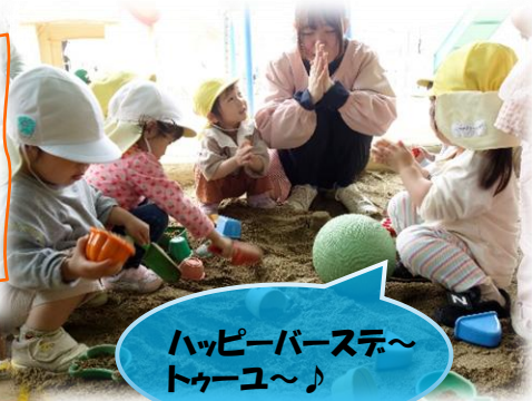
ハッピーバースデー～トケユ～♪

楽しいこと、みつけた! 新しいお友だちや先生と、好きなあそびを みつけた! たくさん体を動かしたり、見立てあそびをしたり、絵の具を使った製作を試してみたり…♡あそびの中でいろいろな わくわく に出会っています♪