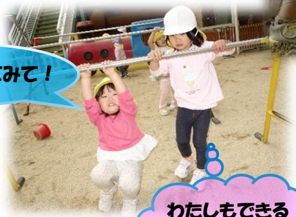
わたしもできるかな…?