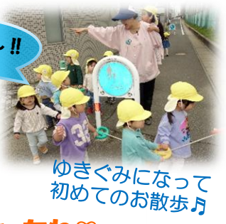
ゆきぐみになって初めてのお散歩♪