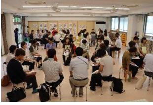
参加者グループで話し合い