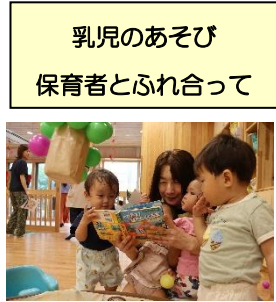
乳児のあそび 保育者とふれ合って