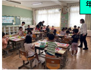
年長児が卒呂小で活動しました