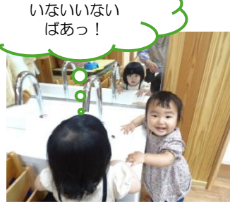
いないいないばあっ!