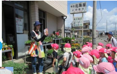
北海屋さん(ご近所の園芸店)に お花の種を買に行きました♪