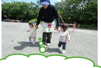
いっしょにあんよ