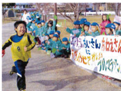
マラソンは月組も応援に来てくれました！

冬休み中はフルマラソンにみんなで挑戦したり、スケートをしに行ったりと楽しく過ごすことができました。長期休みのときは、子どもたちが楽しめるイベントを積極的に行っていきたいと思っています。