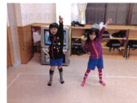
お遊戯会の練習も始まりました。