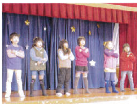
クリスマス会では有志による発表を行いました。