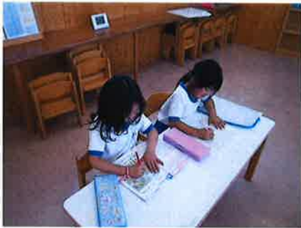
宿題は自分たちの意思で行います。

1年生も宿題が出るようになりました。真剣に黙々と取り組む子、友だちと話しながら楽しく進める子といろいろですが、児童クラブで宿題を済ませる子は、おうちでは必ず確認はしてくださいね。過ごしやすいこの季節、屋上や園庭でいっぱい遊ぶ子どもたちの姿が見られますよ～。