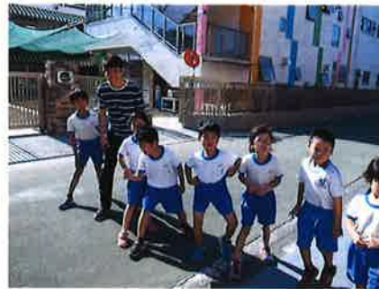
リレーマラソンに向けて練習しています。