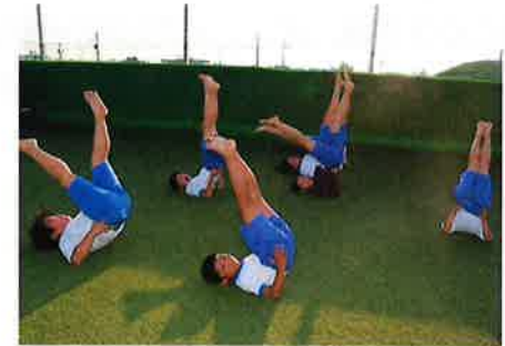
ヨガにも挑戦しました。