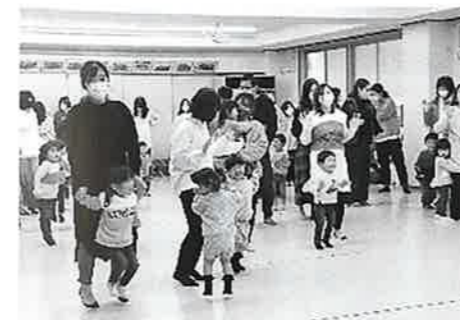
【園児デイリープログラム (一日の保育の流れ)】