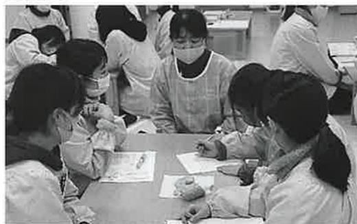
写真1 保育者による保育カリキュラムマネジメント

0～5歳児の元気な「おはようございます！」やあどけない笑顔、あるいは母親と離れる不安からの泣き声で毎日の園生活はスタートする。子どもたちは母親、父親、時には祖父母と手をつないだり抱っこされたりして、毎朝保育者のところへ登園してくる。私たち保育者は子どもたちを笑顔で迎え、保護者にも「ご苦労様、行ってらっしゃい」などとあいさつを交わし見送る。保護者の就労状況や家族構成などにより、早朝や夕方の延長保育を含めると子どもたちの園で過ごす時間は一律ではない。保育者は子ども一人ひとりの1日の健康状態や成長などに