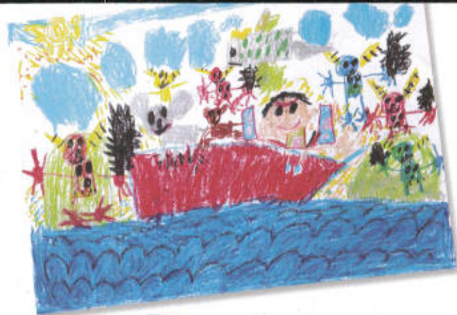
桃太郎のお話を観て、絵を描きました。 (5歳児)

絵本や紙芝居の1場面を見せて、「このように描きなさい」とか「どこか選んで描きなさい」といって描く絵は、模倣です。お話を聞いて絵を描くときにも、子どもの感動を絵にすることが大切です。ただし、子どもたちは知らないものを描くことはできませんので、事前に登場する場所や動物の絵を描いたりしておくといいでしょう。