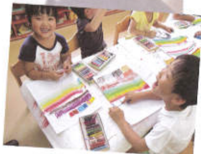
クレヨンで絵を描いている4歳児クラスの子どもたち。