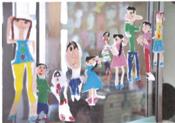
手と手をつないでクラスの窓に展示しました。