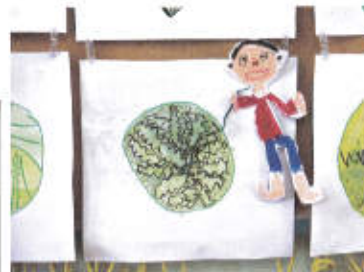
個人の制作と組み合わせてもいいですね。