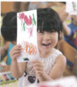
お花を描いたよ。(3歳児)