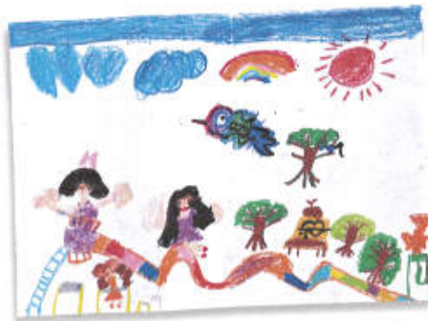
滑り台が、ジェットコースターみたいになったよ。(5歳児)