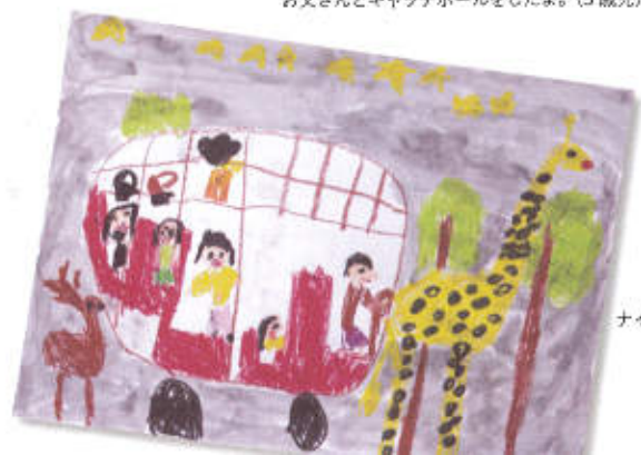
ナイトサファリに行ったよ。(5歳児)

子どもの楽しかった思い出やがんばった経験を絵にしましょう。たとえば、運動会の思い出を絵にすると、玉入れに勝ったクラスの子どもたちは楽しんで絵を描きますが、負けたクラスの子どもたちは絵を描きたがりません。これは自然な感情ですので、無理に同じ場面を絵にするのではなく、楽しかった運動会のシーンを引き出して絵にするといでしょう。