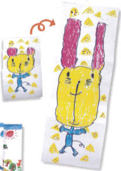
クマの耳がビューンとのびて、ウサギに変身。(5歳児)